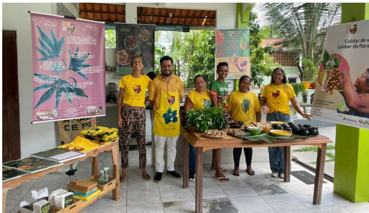
Figura 2 | A Cesta Ajuri como expressão concreta da hibridização entre práticas produtivas rurais e dispositivos urbanos de comercialização, evidenciando a reorganização contemporânea das RCCs em Manaus.